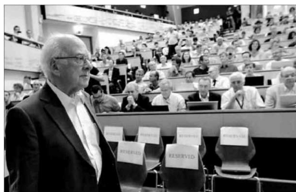
Peter Higgs, ayer a su llegada al auditorio del CERN.

"La partícula de Higgs es una partícula subatómica muy pesada y ésta solo se puede generar en un acelerador de partículas como el Gran Acelerador de Hadrones (LHC) del CERN en la que se aceleran partículas a una energía suficiente para generar la 'partícula de Dios' que es unas 125 veces más pesada que un protón", detalla Burwitz.